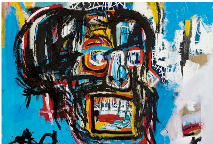
Jean-Michel Basquiat, Untitled , collection privée, 1982.

14 - Etudier la vie et l'oeuvre de Jean-Michel Basquiat. En quoi le tableau "Untitled (Boxer)" montre-t-il un mélange de dégoût et de rage ?