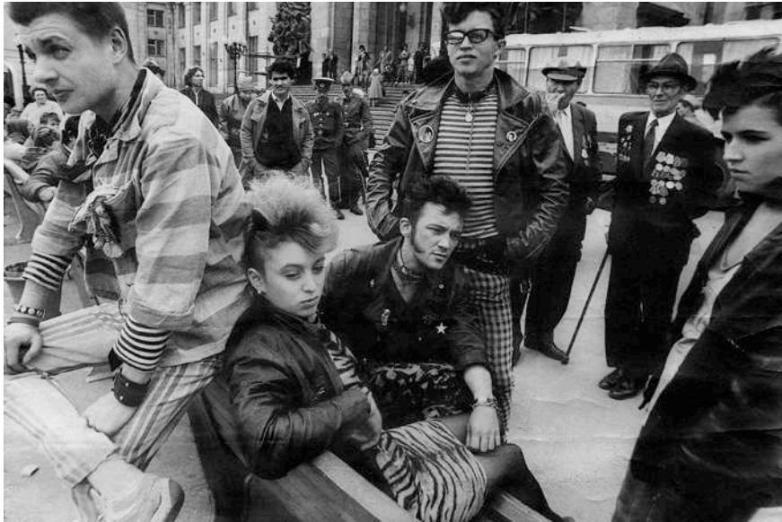
Gosha Rubchinskiy, Youth Hotel , 2015.

13 -Choisir une photographie du recueil "Youth Hotel". L'artiste russe Gosha Rubchinskiy y présente la jeunesse underground désabusée de son pays. Exprimer, dans un court texte, de quelles manières s'exprime la rébellion.