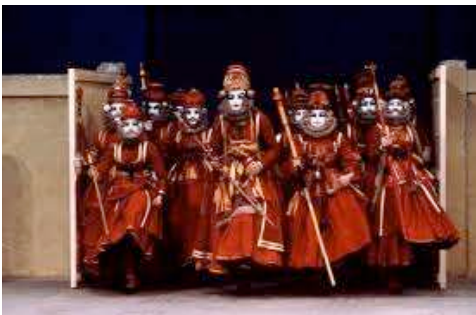
Atrides par Ariane Mnouchkine, Cartoucherie de Vincennes, 1990-1992.