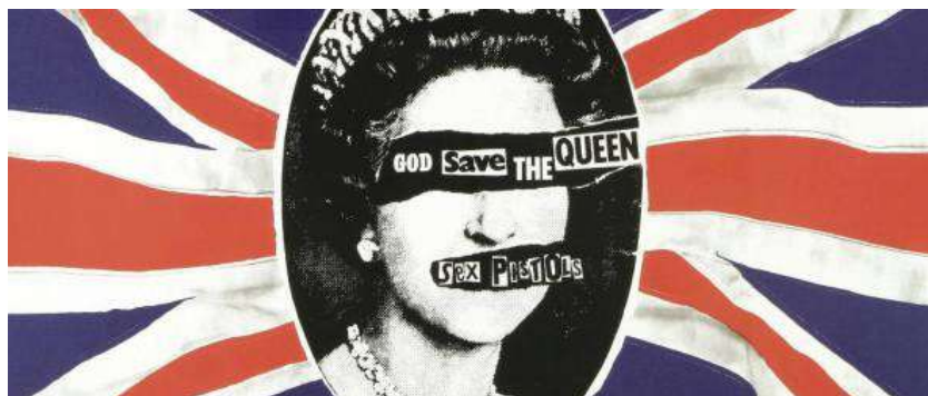
Pochette de "God save the queen" conçue par Jamie Reid, 1977.

- Découvrir le mouvement punk. Ecouter des morceaux des Clash, par exemple "London Calling"(1979), "London's burning"(1977) ou "White Riot"(1977). A associer au film Rude Boy de Jack Hazan (quelques scènes crues) et David Mingay (1980). Ecouter des morceaux des Sex Pistols, "God save the Queen", "Anarchy in the U.K."(1977).