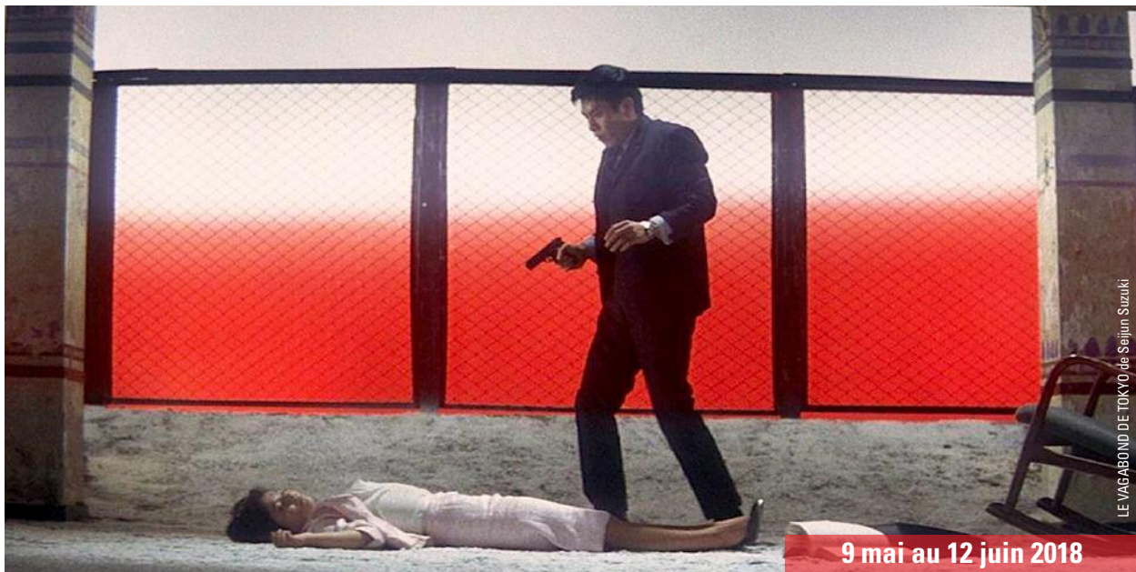
LE VAGABOND DE TOKYO de Seijun Suzuki