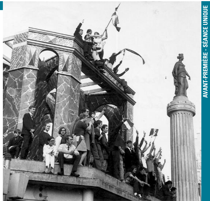
AVANT-PREMIERE - SÉANCE UNIQUE