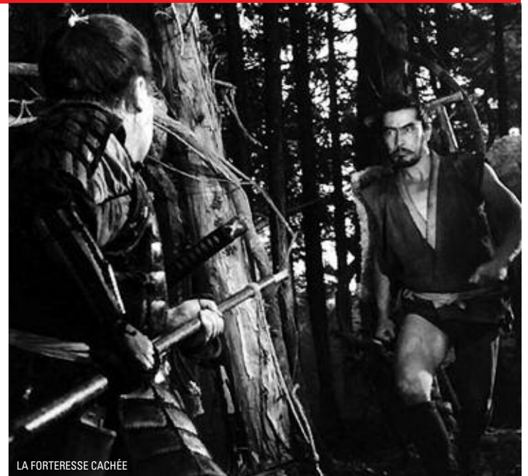
LA FORTERESSE CACHÉE

SYNOPSIS Un groupe formé d'un général, de deux paysans et d'une princesse qui détient le trésor du clan va tenter de rejoindre un territoire ami à travers les affres de la guerre civile du XVIème siècle japonais