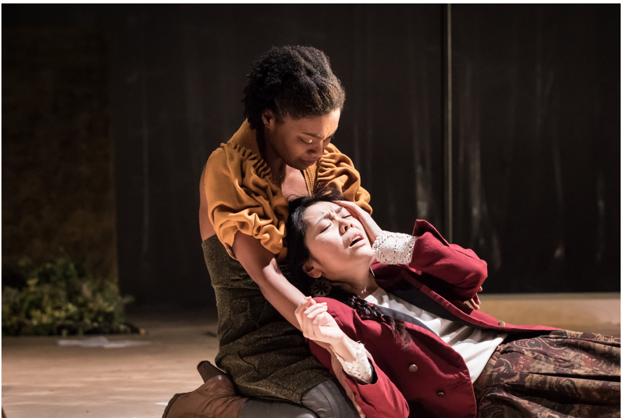
01. crédit photo: Simon Gosselin 02. crédit photo: Simon Gosselin