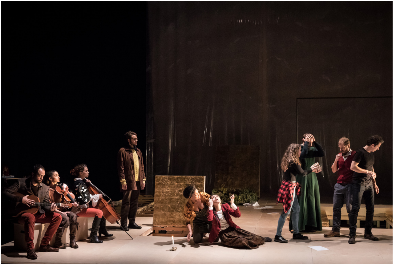
01. crédit photo: Simon Gosselin 02. crédit photo: Simon Gosselin