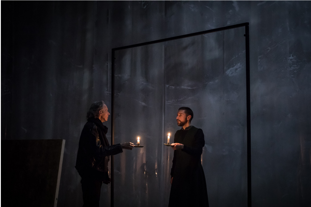
01. crédit photo:Simon Gosselin.