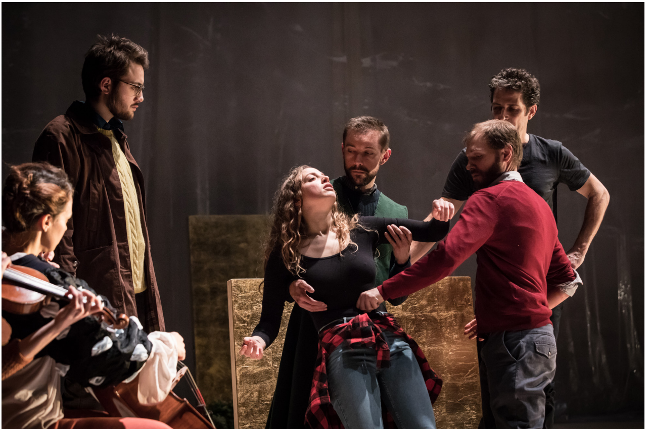
01. crédit photo:Simon Gosselin.