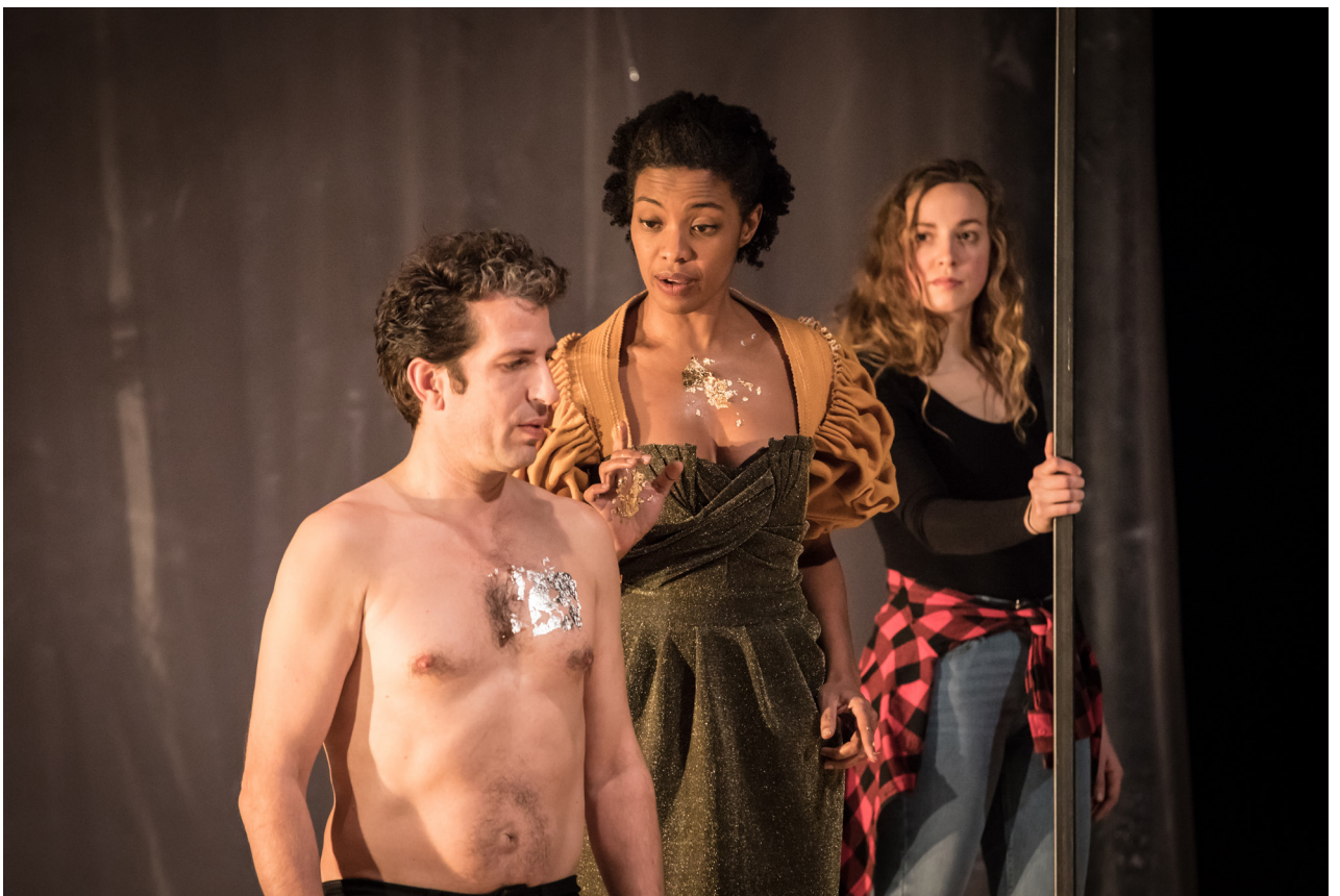
01. crédit photo: Simon Gosselin 02. crédit photo: Simon Gosselin