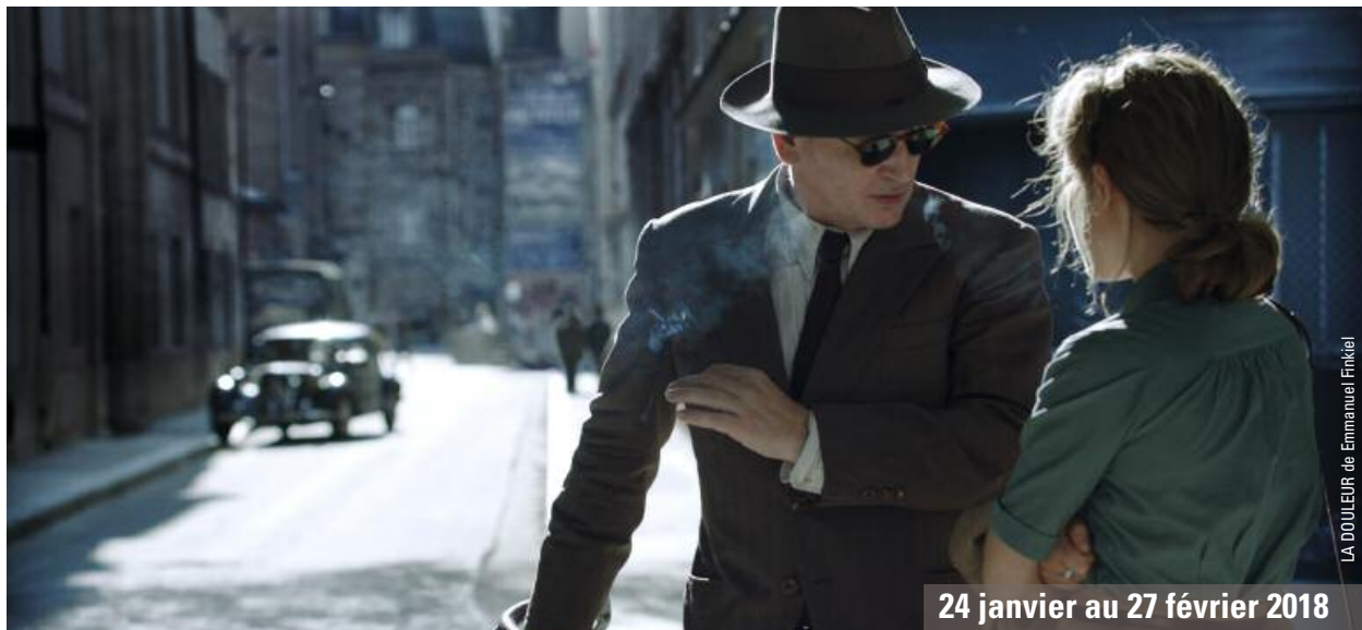
LA DOULEUR de Emmanuel Finkiel